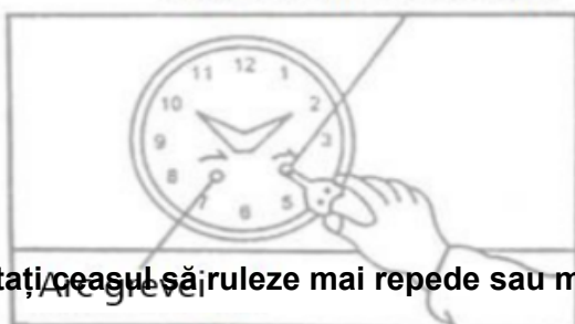
Arcul ceasului mașinărie

Pentru a porni ceasul, mutați pendulul în poziția exterioară dreaptă sau stângă și eliberați-l (vezi figura 5). De îndată ce pendulul începe să se balanseze în mod regulat, ceasul ar trebui să înceapă să bifeze normal.