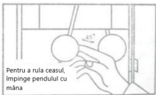
Vedere din spate

Pentru a porni ceasul, mutați pendulul în poziția exterioară dreaptă sau stângă și eliberați-l (vezi figura 5). De îndată ce pendulul începe să se balanseze în mod regulat, ceasul ar trebui să înceapă să bifeze normal.